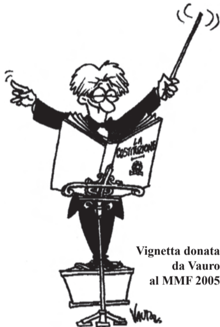
Vignetta donata da Vauro al MMF 2005

Parte il Mantovamusicafestival e la città si immerge in una dimensione che già conosce e vuole rivivere. Suona, la città. E sogna. Si diffondono melodie e notizie improbabili. C'è chi parla della laurea honoris causa a Vasco Rossi. Possibile? Possibile, perché no?